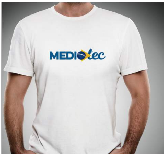
SOBRE FUNDO CLARO